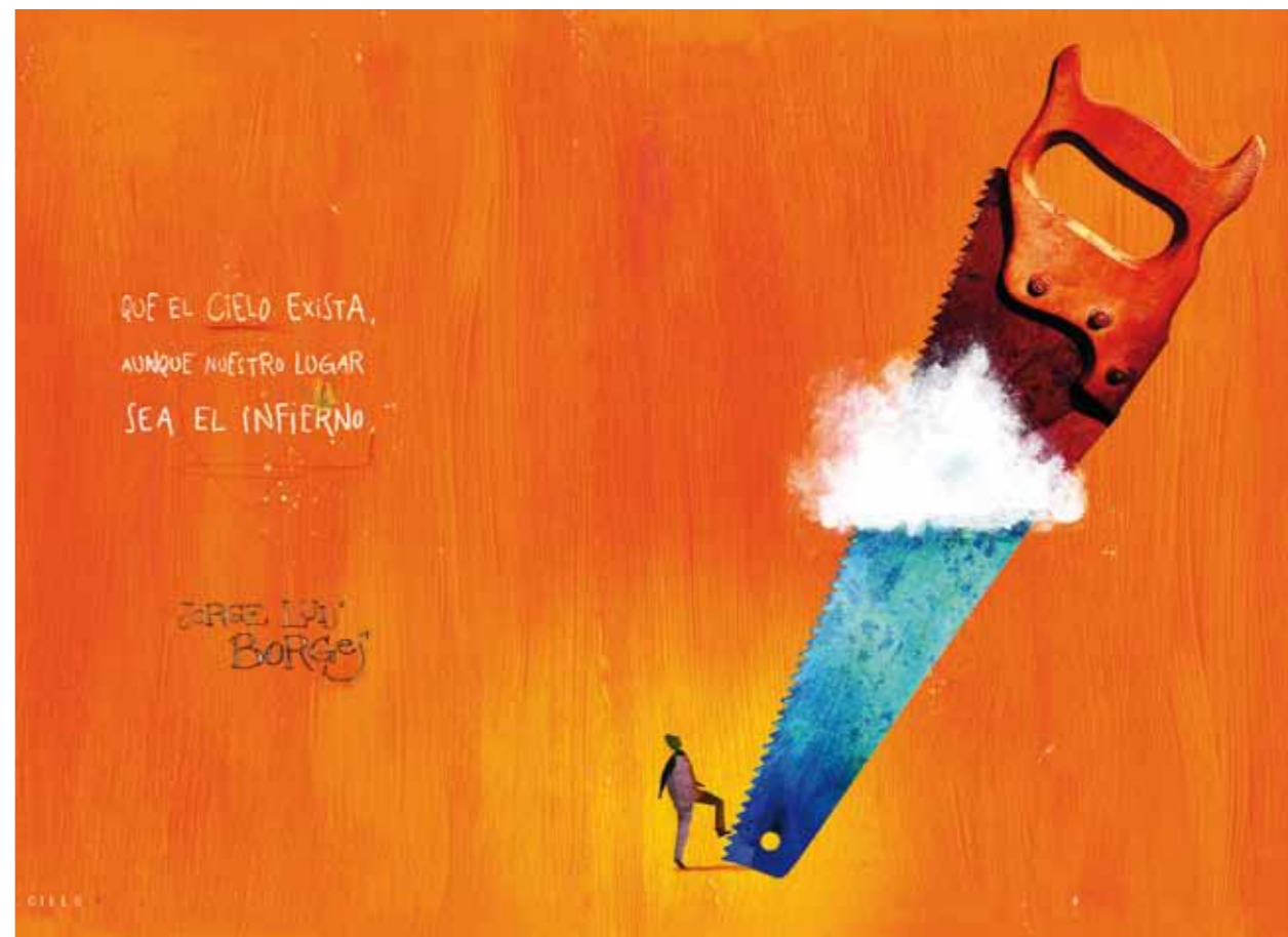
Arriba Izquierda: Edgar Allan Poe. Arriba derecha: Cielo +.

También explica detalladamente en qué consiste este nuevo objeto literario que día a día está ganando más terreno, el libro-álbum. En él, tanto el texto como la ilustración tienen el mismo peso y trascendencia. Si uno sólo lee, algo se pierde y si uno sólo mira, algo falta. “El nivel narrativo es muy especial, primero se inventa la trama,